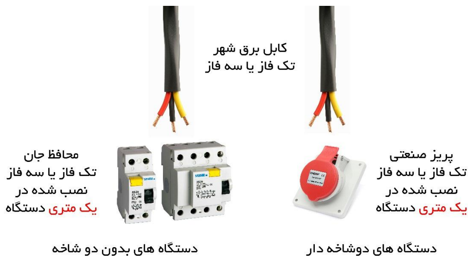
دستگاه‌های بدون دو شاخه